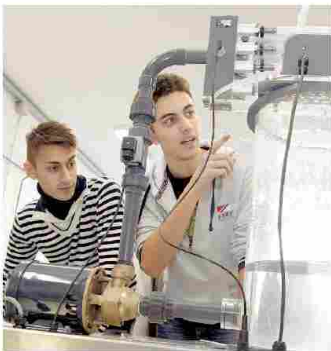
Studenti dell'Istituto Vallauri di Fossano